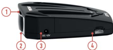
СХЕМА УСТРОЙСТВА РАДАР-ДЕТЕКТОРА